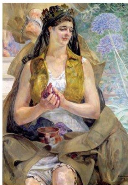
Jacek Malczewski, Polonia, personifikacja Polski Odrodzonej , 1918, olej na tekturze, 100 cm x 72,5 cm, Muzeum Narodowe, Kielce

(1821–1883), wybitny poeta, dramaturg, prozaik, zajmował się też grafiką, malarstwem i rzeźbą. W 1842 r. opuścił Warszawę. Większą część życia spędził w Paryżu. Żył w nędzy i utrzymywał się z prac dorywczych. Jego twórczość, niezrozumiana przez jemu współczesnych, została zapomniana i odkryto ją dopiero na początku XX w. Do najważniejszych utworów Norwida należą: Czarne kwiaty , Białe kwiaty , Promethidion oraz liczne zbiory wierszy, np. Vade-mecum .