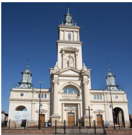
Kościół lokalny np. parafia