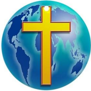
Kościół powszechny – chrześcijanie na całym świecie