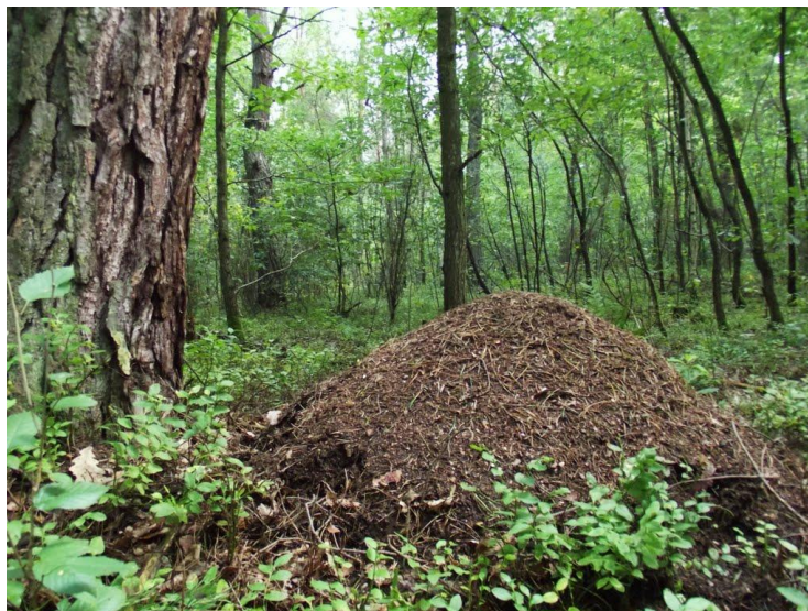
Mrowisko w lesie

Mrówki żyją w dużych skupiskach. Jest ich około 80 gatunków. Budują mrowiska, które w Polsce są pod ochroną. Najważniejszą z mrówek jest królowa, pozostałe to mrówki robotnice. Mrówki są wszystkożerne. Chronią las przed szkodnikami.