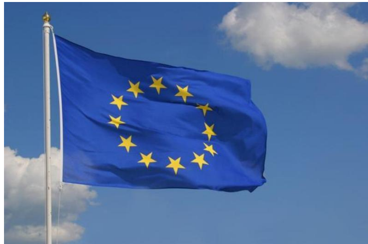
Flaga Unii Europejskiej

Co roku 1 maja obchodzimy Święto Pracy, natomiast 9 maja obchodzimy Święto Unii Europejskiej. Polska jest członkiem Unii Europejskiej od 1 maja 2004r.