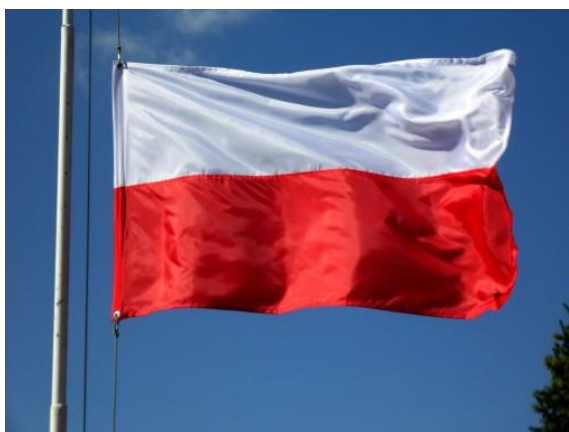
Flaga narodowa Polski