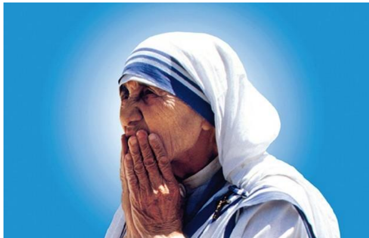
Matka Teresa z Kalkuty