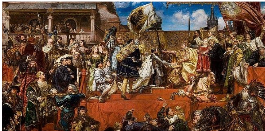
Jan Matejko „Hołd pruski”