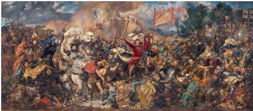
Jan Matejko – „Bitwa pod Grunwaldem”