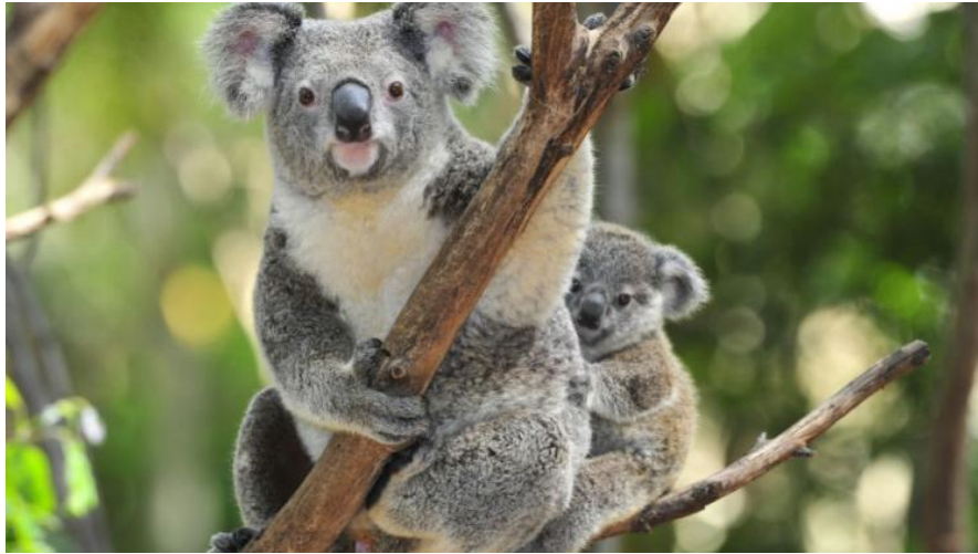
Koala – jego przysmakiem jest eukaliptus