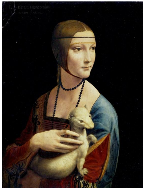
„Dama z gronostajem” (potocznie nazywana często „Damą z łasiczką”)