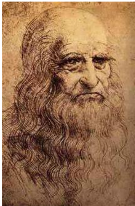
Leonardo da Vinci – autoportret