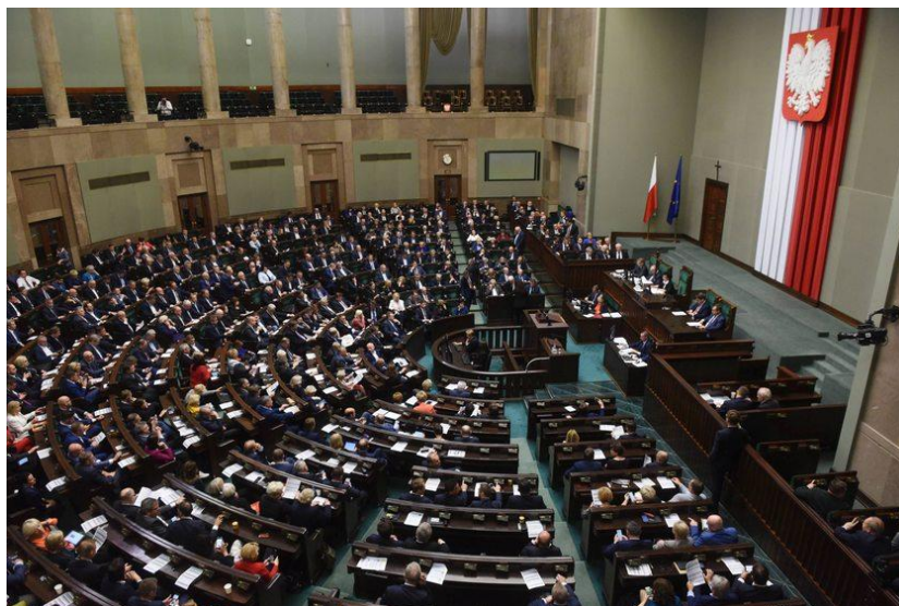
Sala sejmowa w trakcie obrad

Jakimi sprawami chciałbyś się zająć, gdybyś zasiadał w Sejmie dla dzieci?