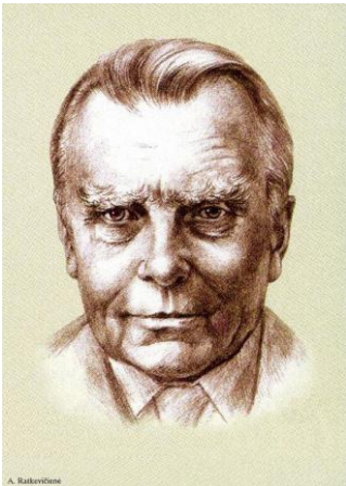
Czesław Miłosz 1911–2004

Polski poeta, pisarz. W 1980 r. otrzymał literacką Nagrodę Nobla za całokształt twórczości. W zbiorze wierszy pt. „Świat (poema naiwne)” opisuje piękną krainę dzieciństwa. Z tego tomiku pochodzą wiersze: „Droga”, „Ganek”, „Ojciec objaśnia”, „Przypowieść o maku”, „Słońce”.