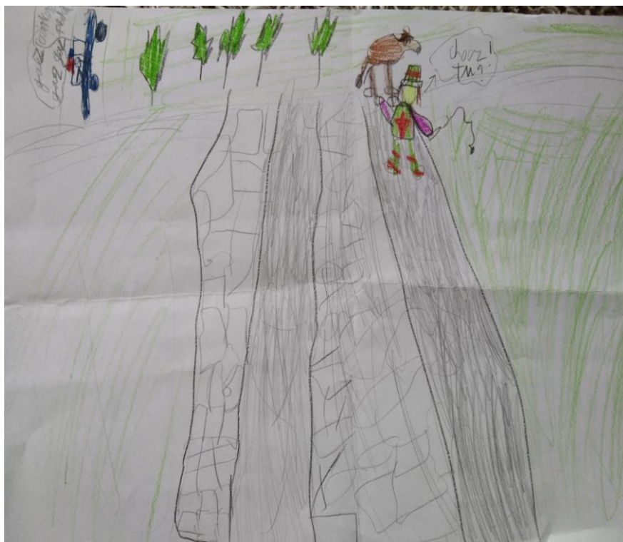
Autor: Krzysztof Zajac, kl. IV ai