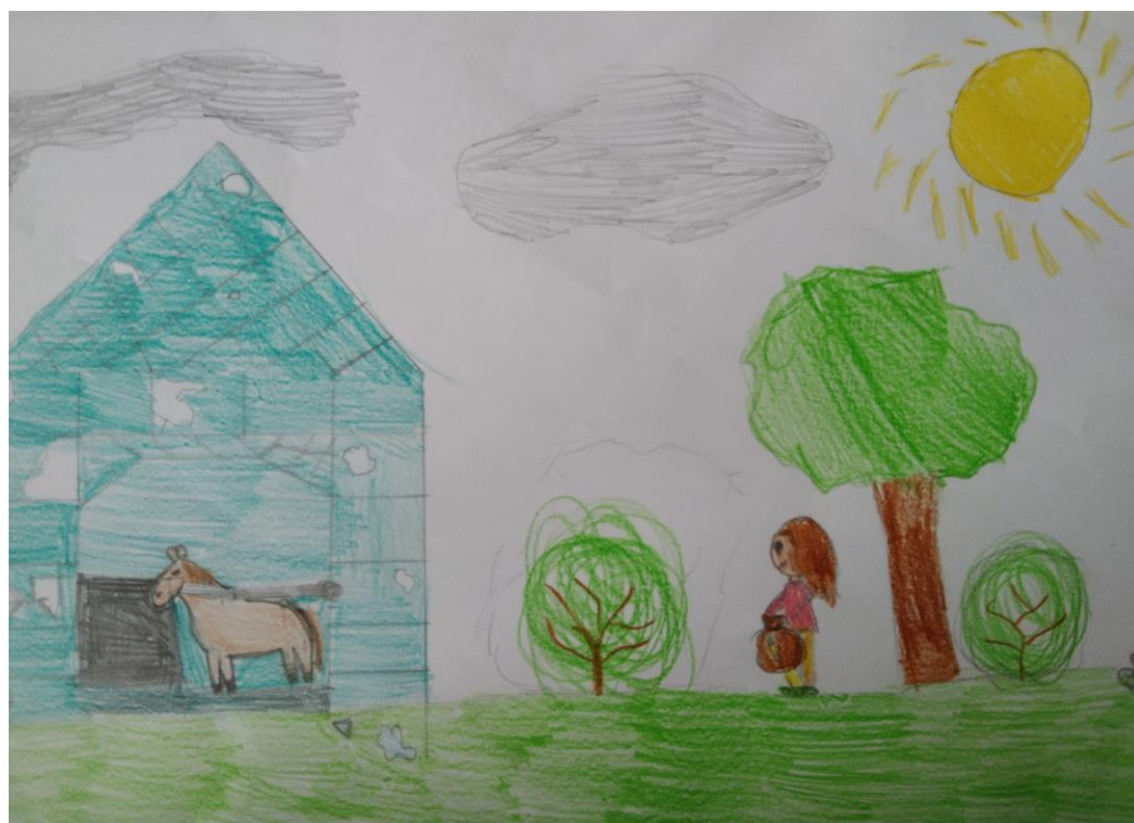
Autor: Ola Kotkowska kl. IV ai