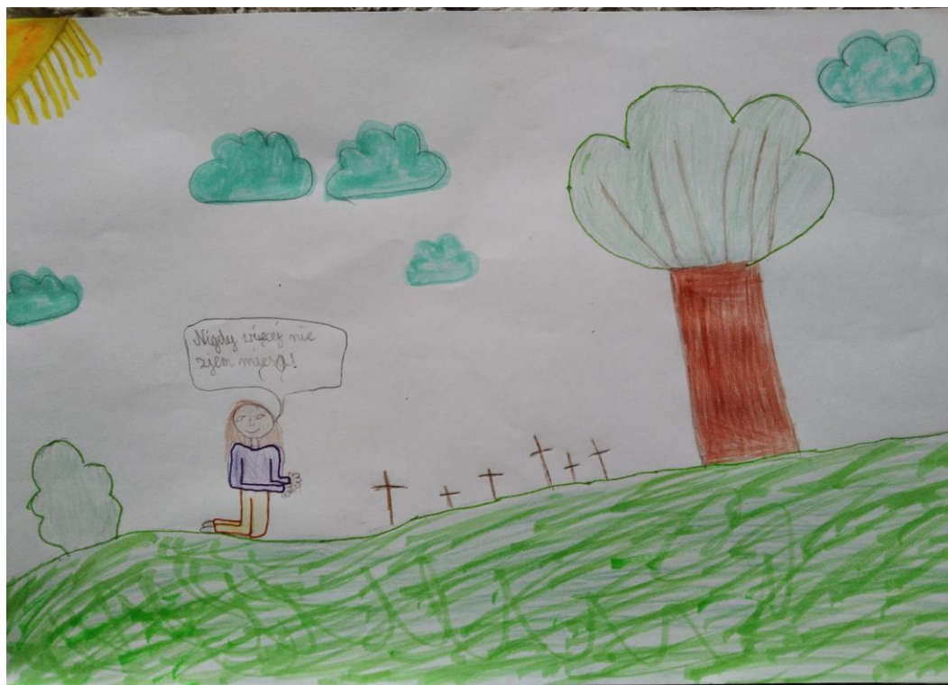
Autor: Nikola Serafin kl. IV ai