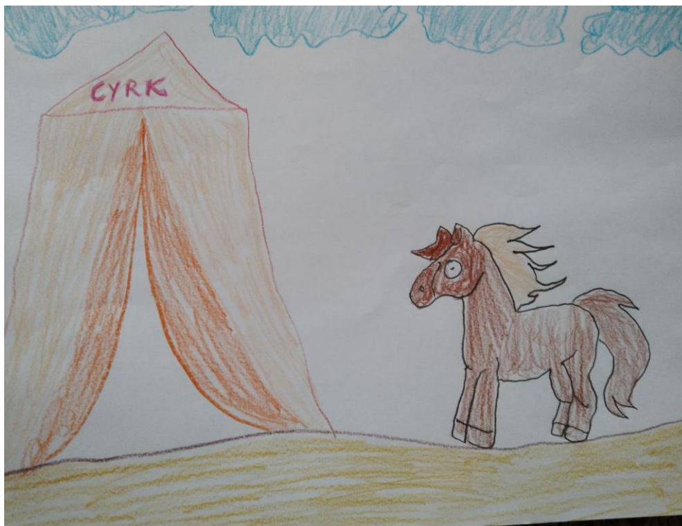
Autor: Igor Jęzak kl. IV ai