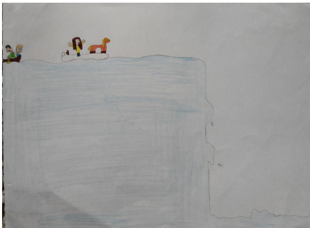
Autor: Liwia Ogińska kl. IV ai