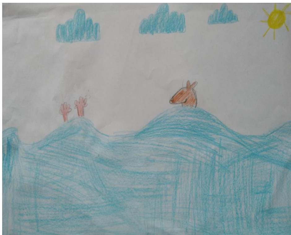
Autor: Zuzia Kowal kl. IV ai