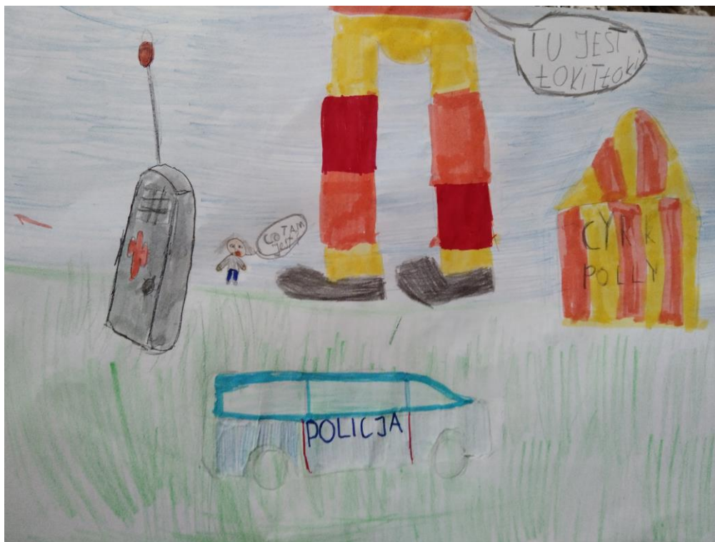
Autorzy: Michał Baran, Szymon Sołtysiak, Miłosz Zych