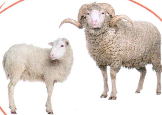
owca i baran