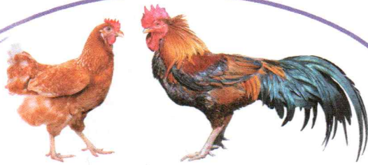
kura i kogut