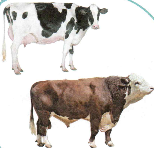
krowa i byk