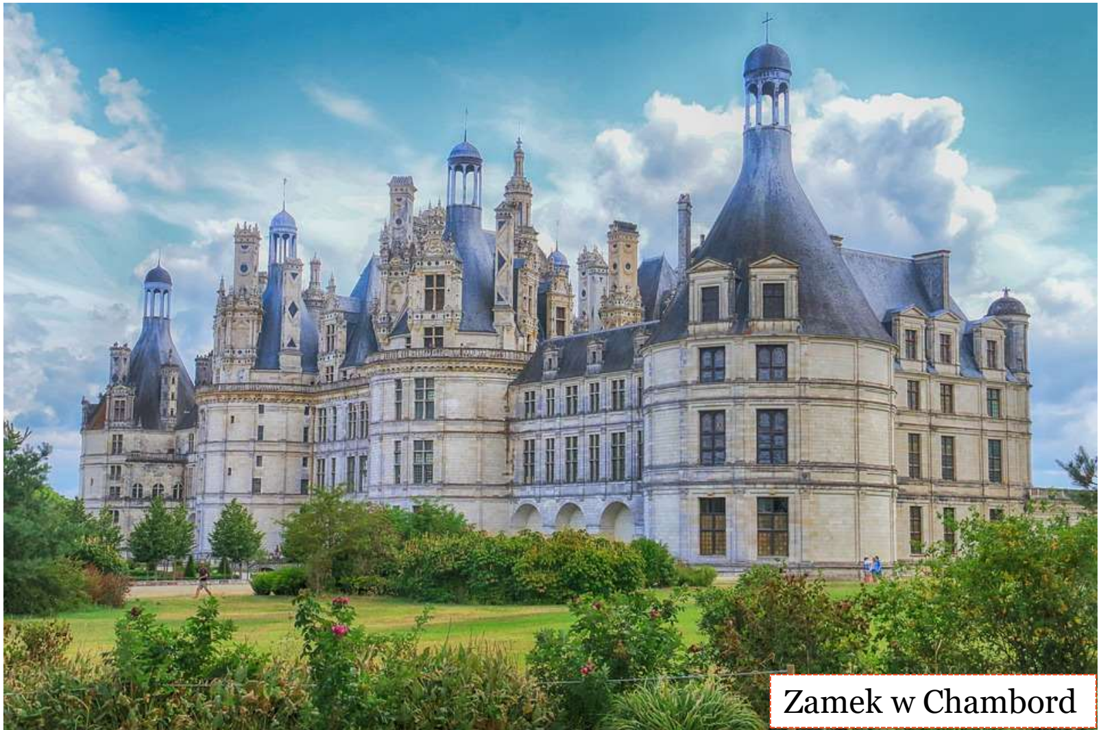
Zamek w Chambord